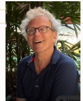
Joachim Baar, Pianist, Liedbegleiter 1. Preisträger des „Festivals Internazionale di Musica Vocale“ in Carpi, Italien, Konzerterfahrung in europäischen Ländern, Südamerika und Singapur